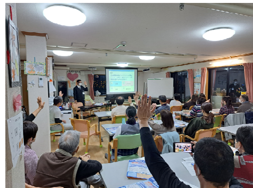
▲防災に関する出前講座