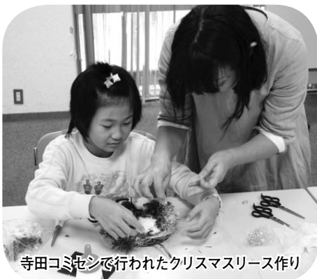
寺田コミセンで行われたクリスマスリース作り

市では、12月19日(月)からの冬の期間中市役所庁舎などの電灯の間引き消灯など、節電に向けた取り組みを行っています。みなさんも、ご家庭で年末・年始を除く平日9:00~21:00の間、節電にご協力をお願いします。