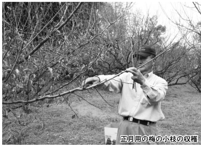
正月用の梅の小枝の収穫