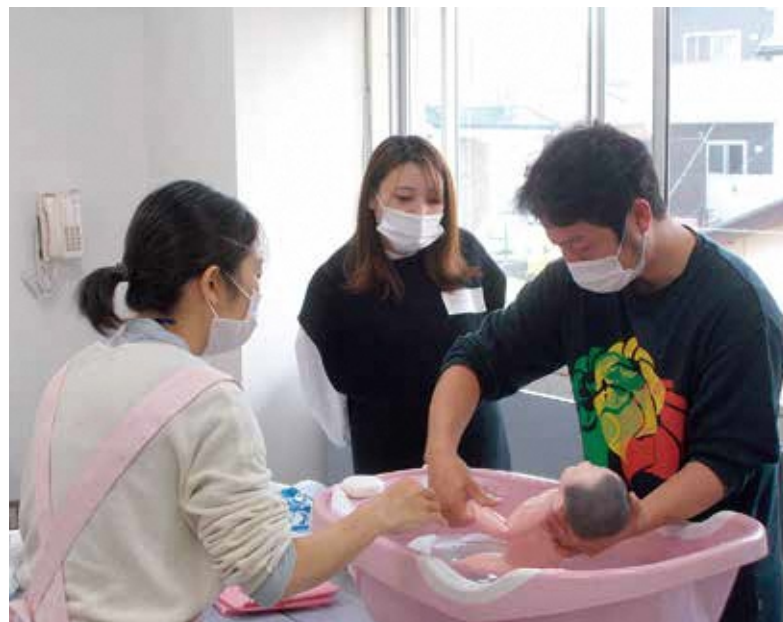
ぱれっとJOYOで実施した「沐浴練習」の様子。赤ちゃんの抱き方や洗い方など講師に質問しながらの実践講座でした。

今後もぱれっとJOYOから「男女いきいき 笑顔あふれる 元気なまち」を発信できるよう、地域のみなさんとともに男女共同参画の取り組みを進めていきます。みなさんの活用をお待ちしています。