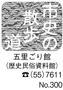
五里ごり館(歴史民俗資料館) ☎(55)7611 No.300