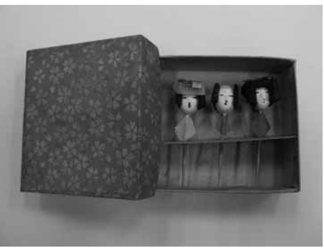
姉様人形：桃の節句の季節、お雛様を前に人形やママゴトに夢中になっていた人も多いことでしょう。現在資料館で展示中です

この人形は、千代紙で着物を折り、胴体を作った着せ替え遊びを楽しむことができました。戦後になると、粘土や紙などの素材で作られていた玩具もビニールやプラスチック製のものと変わってしまいましたが、お洒落に憧れる女の子の着せ替え遊びは、今も昔も変わらず愛され続けています。