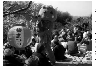
梅まつり会場の様子

☆梅まつりの様子は、2月27日(土)11:30～11:45に市広報番組「ハロー城陽」(KBS京都34チャンネル)で放送されます!取材班が2月20日(土)に訪れますので、ぜひお越しく下さい。