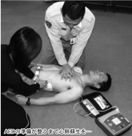
AEDの準備が整うまで心肺蘇生を...

「ピーポーピーポー」響くサイレンの音。救急車は人命を救うため現場へと急ぎます。でも、突然心臓が止った人を助けるには一刻も早い蘇生が必要です。そこで、救急車が到着するまで、命をつなぐのがAED(自動体外式除細動器)です。市では学校や公共施設にAEDを設置しています。今号は消防署の二俣救急救命士にAEDについて話を聞きました。一つしかない大切な命・あなたの力で救急隊員へと命のバトンをつないでください。