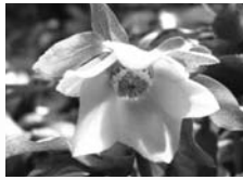
クリスマスローズ

クリスマスローズは、新しい根と葉が生え始める秋が植え替えの最適期です。今回はクリスマスローズの植え替えについて紹介します。