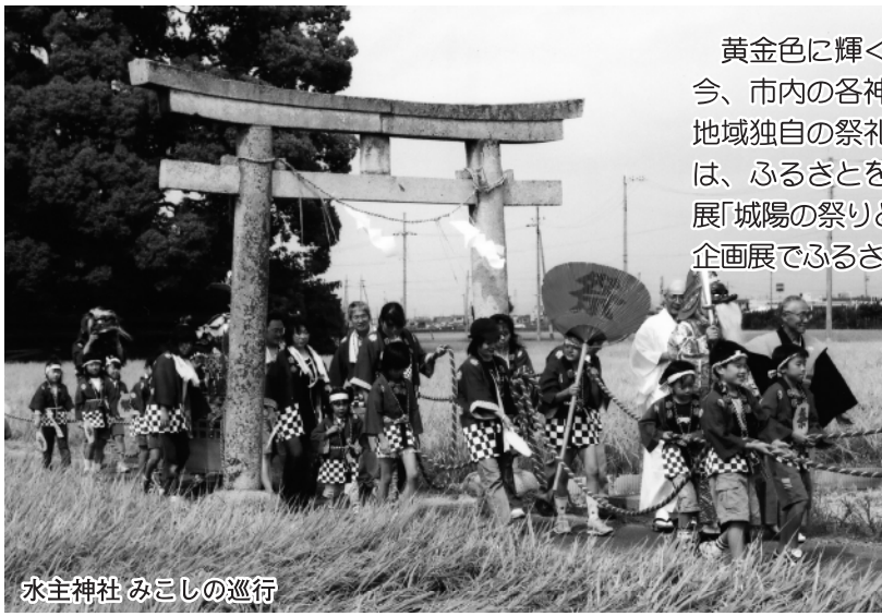
水主神社 みこしの巡行

黄金色に輝く稲穂。暖かい灯りをともす大きな提灯。今、市内の各神社で秋祭りが行われています。祭りは、地域独自の祭りで先人の思いを伝えてくれます。今回は、ふるさとを愛するみなさんでつくられた協働企画展「城陽の祭り」と踊り」をご紹介します。秋のひととき、企画展でふるさとを感じてください。