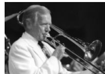
ラリー・オブライエン

◆日程 12月10 日(木)開演19:00/プラムホール ◆全席指 定 一般…前売2,500円(当日3,000円)、高 校生以下…前売1,500円(当日2,000円) ◆ 曲目(予定) ムーンライト・セレナーデ、真 珠の首飾り、イン・ザ・ムード、茶色の小瓶 ほか ※宝くじの助成により特別料金となっ ています ☆リーダー/ラリー・オブライエ ン率いる伝説的ビッグ・バンドのスウィング ジャズを!