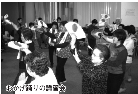
おかげ踊りの講習会

伝統芸能のおかげ踊り 今回のテーマの一つである「おかげ踊り」は、江戸時代末期、伊勢神宮への集団参詣である「おかげまいり」が全国各地で流行した、地域などを単位とした民衆の踊りです。