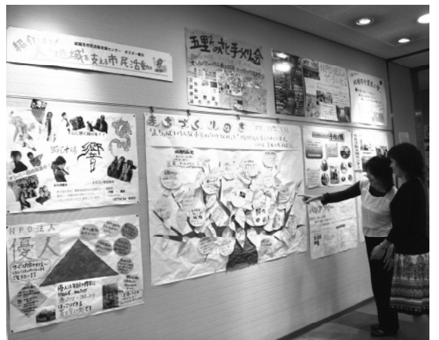
▲市役所で展示の「まちづくりの木」。市内の市民活動団体を紹介しています

しかし、各団体が個別に活動していく中には「活動や団体自体が知られていない」「参加者やメンバー、後継者の不足」「活動力向上のための学びの不足」「財政が厳しい」など、さまざまな共通する課題があります。