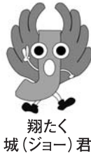
翔たく君 城(ジョー)

出会い—ふれあい—ふるさと城陽☆味めぐり☆ 日時 11月3日(祝)午前10時～午後4時 場所 文化パルク城陽