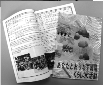
▶市民活動を 紹介した冊子

市民の活動から生まれた おりなすキャンペーン 城陽 今大きな注目を集めている「市民活動」。市民のまちづくりに対する関心の高まりを背景に、市内でもNPO法人をはじめとすると多くの団体が、環境やまちづくり、高齢者福祉や子育て支援、文化やスポーツといった幅広い分野において活発に活動されています。