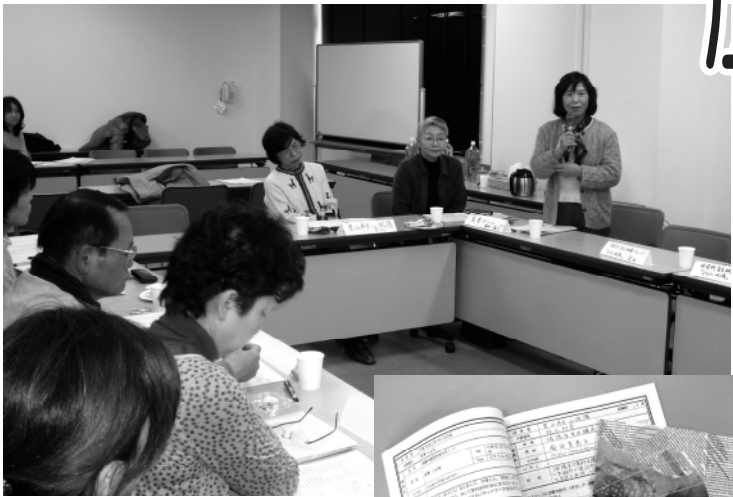
▲市民活動団体の交流会のようす

市内では多くの市民団体などが、まちづくり、子育て支援、スポーツといった幅広い分野で活発に活動されています。また、市民団体の有志により、団体同士がつながりの中でそれぞれが抱える課題などを解決しようとする組織も立ち上がっています。さらにこのほかに、市民団体による緑化活動への支援制度が、公益財団法人により府下で初めて城陽に設置されました。今号では、他団体に先駆けたさまざまな城陽の市民活動をご紹介します。