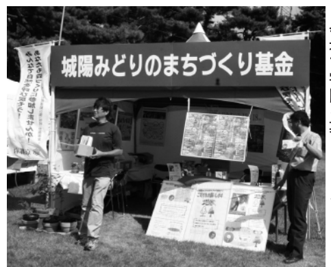
▲パナソニックオープンゴルフ大会 会場ですべての寄附金を募りました

■11月30日(月)までに、申請書を(財)京都地域創造基金へ郵送が直接 ※申請書は市役所都市計画課・市民活動支援室と、市民活動支援センターに設置しています。また京都地域創造基金のホームページからもダウンロードできます