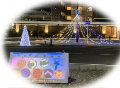
12月 イルミネーション