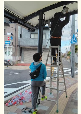
小学生も手伝ってくれました