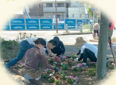
6-10月 花いっぱい運動

寺田駅西口駅前広場や東側駅前広場を中心に時節に応じた飾り付けや花を植えて、行きかう人の目を楽しんでいただいております。