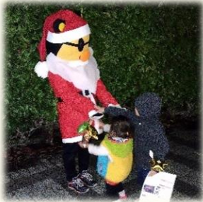
「てらちゃん」大人気！