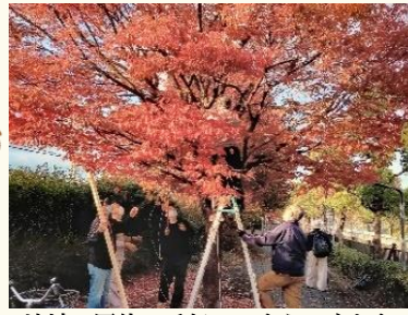
地域の団体に手伝ってもらいました