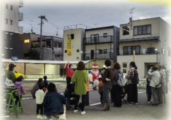
点灯式でにぎわいました！