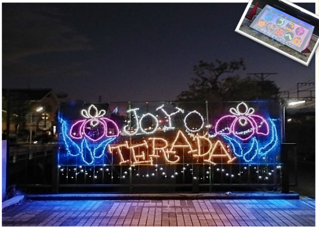
12月 イルミネーション