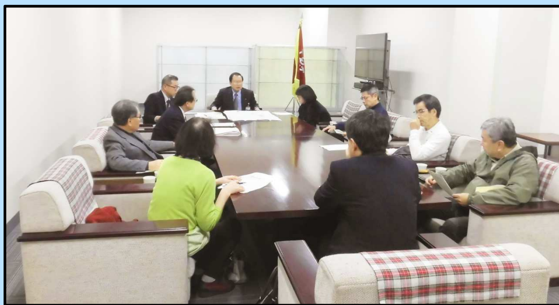
奥田城陽市長と当協議会役員との懇談会の様子

寺田駅前まちづくり協議会では、引き続き、地元の皆さまの意見とともに住み良いまちを目指し、さまざまな交流を通じて地域の活性化が図れるような、まちづくりの検討行っております。