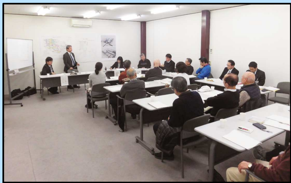
寺田駅西側まちづくり（案）説明会の様子