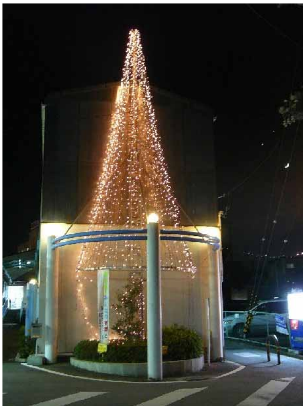
(寺田駅西口のイルミネーション)

冬の寒空の寺田駅前を明るく暖かく照らしたい！そういう思いで始めた駅前のイルミネーションも今年で6回目となりました。11月末から協議会会員で駅前にイルミネーションを飾り付け、12月から約2ヶ月間、夜の寺田駅前を明るく照らしました。