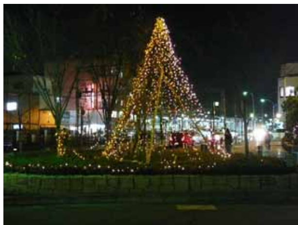
(寺田駅東側駅前広場内のイルミネーション)

去年に引き続き、寺田駅東側でも、寺田駅前広場にイルミネーションを飾り付けました。通行される方から「駅前広場が華やかになった」「優しい光に癒されます」という意見が寄せられるなど、駅前の環境改善や話題づくりに一役買いました。