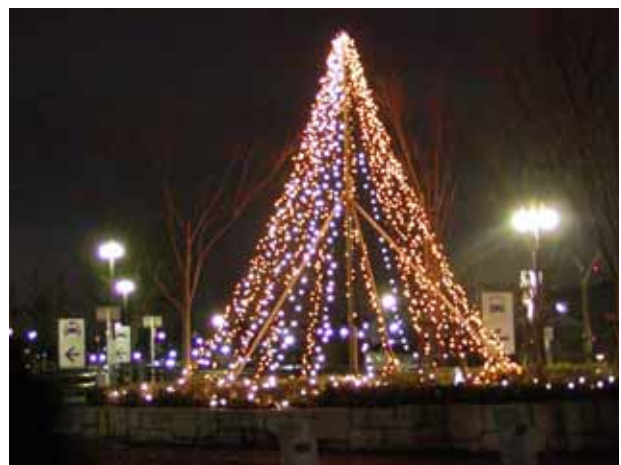
(駅前広場のイルミネーション)

また、寺田駅周辺が美しい光で包まれるよう、皆さんも一緒にイルミネーションの飾り付けにご参加ください！（詳細裏面）