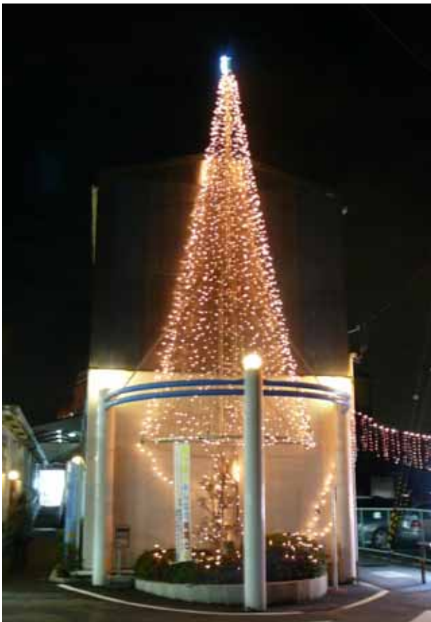
(寺田駅西口のイルミネーション)