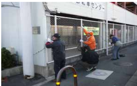
(協議会会員が飾り付けを行っています)

今年も寺田駅前まちづくり協議会では寺田駅前にイルミネーションを飾り付け、冬の寺田駅前を2ヶ月間明るく暖かく照らします。昨年は新たに駅東側にもイルミネーションを飾り付け、通行される方から、「駅前広場が華やかに彩られた」という意見が寄せられるなど、好評を博しました。