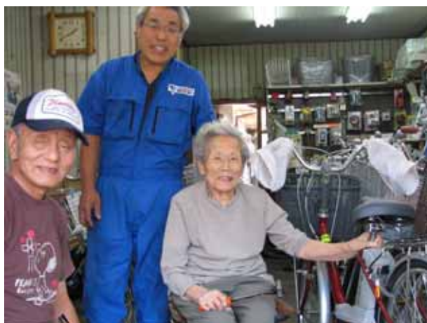
(みんなで記念撮影)

今後も、このように寺田駅周辺で元気に頑張っている人たちをはじめ、ホットな情報をいろいろ紹介していきます。お楽しみください。