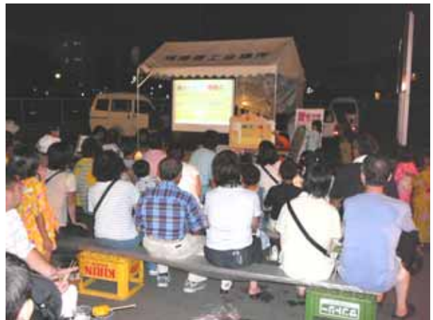
(スクリーンを使って夜も上映)