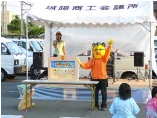
(紙芝居の始まりです!)