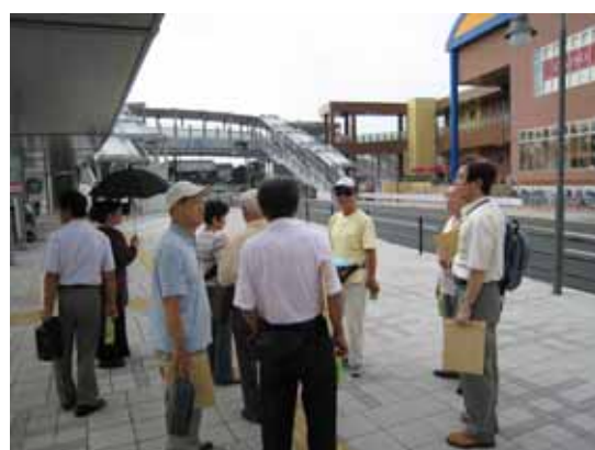
( J R 祝園駅前の西側駅前広場にて )

協議会では、今後ともこうした視察や勉強会を通して将来のまちづくりについて考えていきたいと考えていますので、皆様のご参加・ご協力をよろしくお願いいたします。