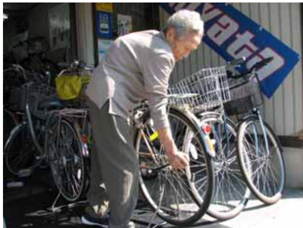
(まだまだ現役です)

自転車屋さんを営まれて50年以上たち、その間、寺田のまちも時代とともに移り変わってきましたが、このお店の中には昔と変わらない時間がずっと流れているように感じました。