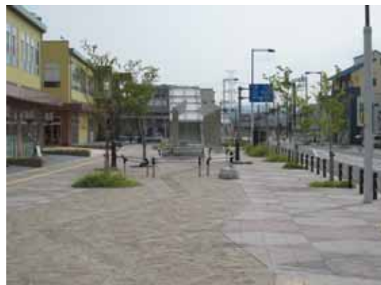
( J R 祝園駅前の駅前大通り )