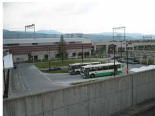
( J R・近鉄三山木駅前の駅前広場 )