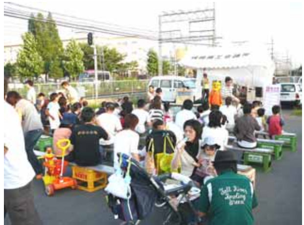
(あっという間に、人だかりに)

夏まつり全体としても今年から会場が城陽市教育委員会駐車場に変わり、歌やダンスのパフォーマンスもあって例年以上に多数の来場者数となり会場は大いに盛り上がりしました。