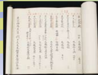
「貞享五年具中曆」 皆川春海作成 （じょうきょうごねんぐちゅうれき） 大將軍八神社蔵（京都市） 府指定有形文化財