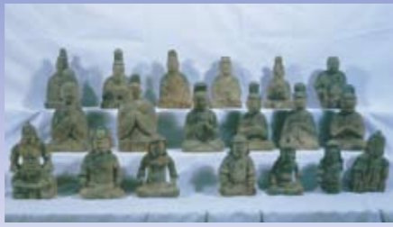
「大將軍神像」（だいしょうぐんしんぞう） 市指定文化財 旦稜神社蔵（城陽市）