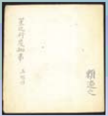
「星行度知事」（ほしのこうどをしるごと） 大將軍八神社蔵（京都市） 府指定有形文化財