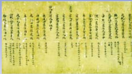
「石氏簿讀」（せきしほさん）若杉家文書 京都府立総合資料館蔵

最も古いと考えられている中国の28の星座のこと。中国の天の赤道あたりに見える星座です。中国の赤道は360°と1/4°とされ現代の値に近いものでした。これを28区分し、そのあたりにある星座（星宿）を選び、その区分に星宿の名前をつけました。月は毎日28宿の星宿のいずれかに「宿る」と考えられていました。