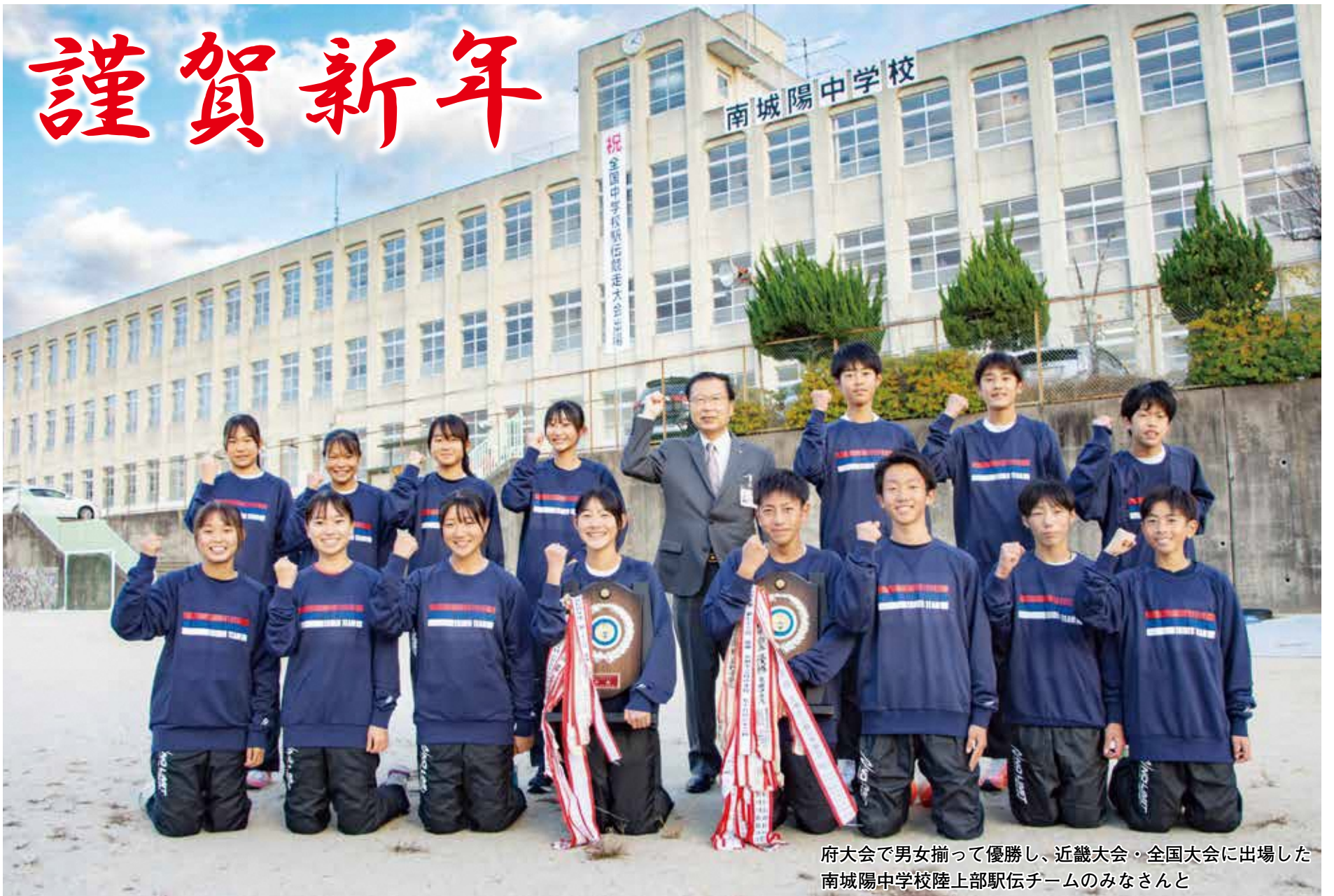
府大会で男女揃って優勝し、近畿大会・全国大会に出場した 南城陽中学校陸上部駅伝チームのみなさんと