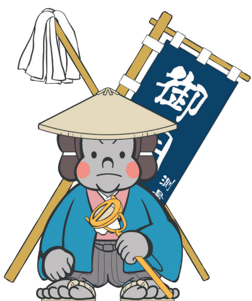
資料館マスコット「ごりごりくん」

日時：11月12日(日) ①11:00~②13:30~ ③14:30~ 対象：小学生以上 定員：各回先着5名 参加費：無料 申込：11月5日(日)10時から電話申込 (お1人様につき2名分まで申込可)