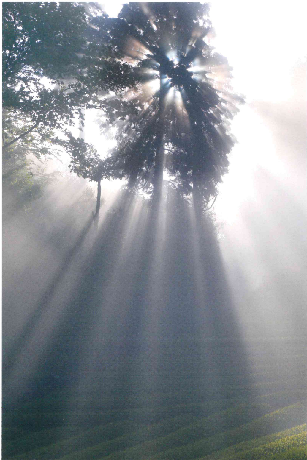
アートギャラリー 2020 市長賞【光彩陸離】(写真) 富山貴史