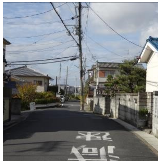
【平成30年撮影】長池桜町（東から撮影）