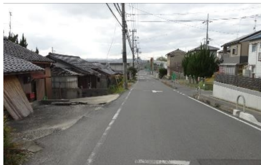
【平成30年撮影】青谷小学校南側道路(東から撮影)