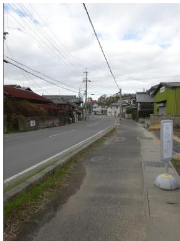
【平成30年撮影】二本松バス停付近（南から）