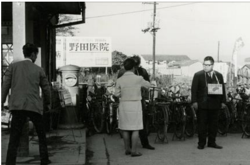
【昭和42年撮影】街頭共同募金