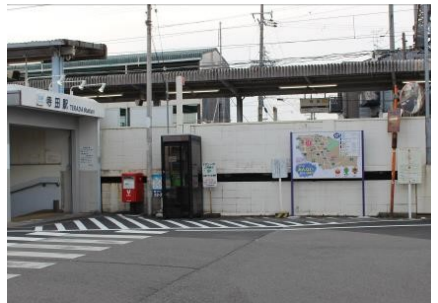
【平成30年撮影】寺田駅前（東から撮影）