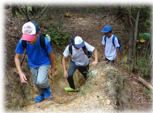
ちょっと急な登りもあります。