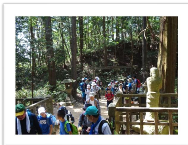
二尊門通過です。 二体の石像が出迎えてくれます。 不動寺はもうすぐです。