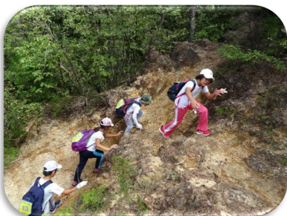
さすが湖南アルプス!!