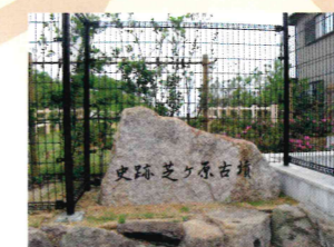
古墳公園(東側入口)