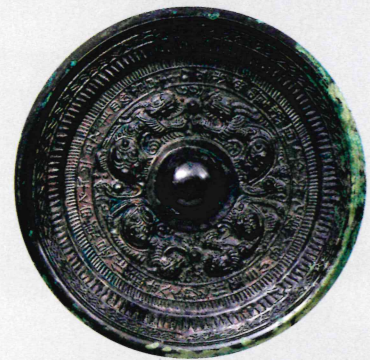
斜縁盤龍鏡(「景初四年」銘鏡) 【広峯15号墳出土】重要文化財