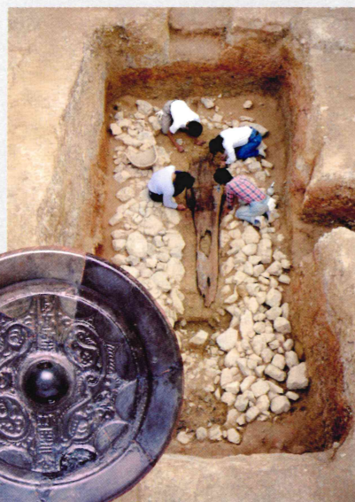
双頭龍文鏡と木棺 【黒田古墳出土】京都府指定文化財