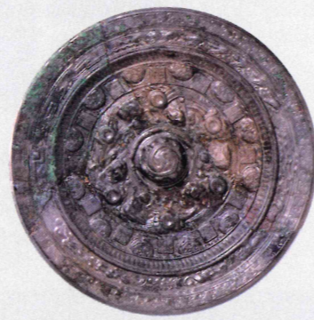
画文帯環状乳神獸鏡 【大田南2号墳出土】京都府指定文化財