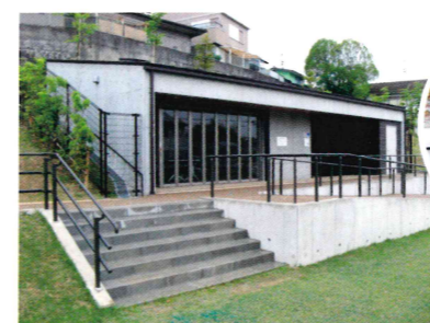
トイレ付き休憩室