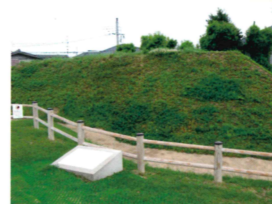
芝ヶ原古墳(北東部より)

直径4mの円卓上に陶板で作った立 体模型で周辺の古墳や古代寺院跡 の説明案内をしています。