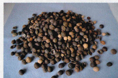
卑弥呼も食べた? 桃の種 【纏向遺跡出土】