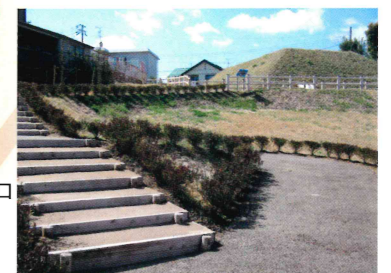
公園広場から 芝ヶ原古墳を望む