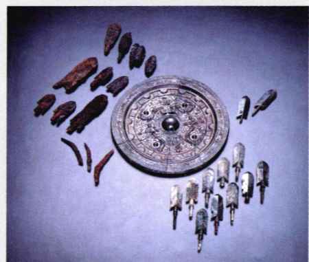
画文帯神獸鏡・銅鏃・鉄鏃・ 「へ」の字形鉄製品 【ホケノ山古墳出土】奈良県指定有形文化財