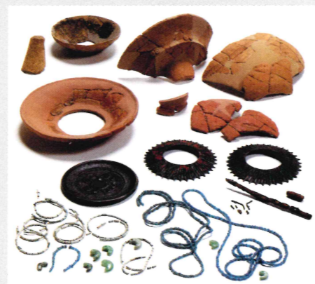
銅釧・玉類 【芝ヶ原古墳出土】重要文化財 城陽市歴史民俗資料館蔵