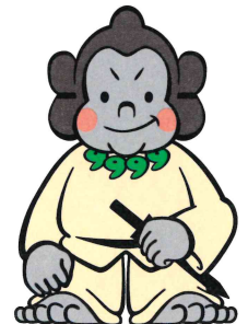
資料館マスコット「ごりごりくん」