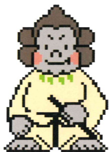
資料館マスコット「ごりごりくん」

■開館時間 午前10時~午後5時(入館は午後4時30分まで) ■休館日 月曜日(祝休日の場合は開館) 祝休日の翌日(土・日曜日の場合は開館) 12月27日~1月4日 ■観覧料 おとな 200円(140円) 小・中学生 100円(70円) <団体料金> おとな 160円(110円) 小・中学生 80円(50円) ※団体は20名様以上 ※( )内はプラネタリウムとの共通観覧の場合の資料館観覧料 <次の方は観覧料が免除されます> ★城陽市内在住の65歳以上の方 ★城陽市内在住の小・中学生 ★城陽市内在住の身体障害者手帳等をお持ちの方 ★城陽市外の小・中学校の団体観覧(ただし、児童・生徒のみ)