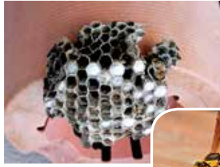
アシナガバチの巣