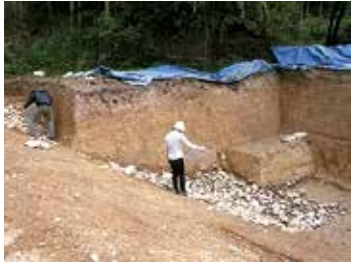
▲久津川車塚古墳の洪水堆積層

府道69号の久津川交差点から東に入ったスーパリーの向かい側に、久津川車塚古墳があります。墳丘の全長が180mあり、南山城最大の前方後円墳で、古墳時代中期