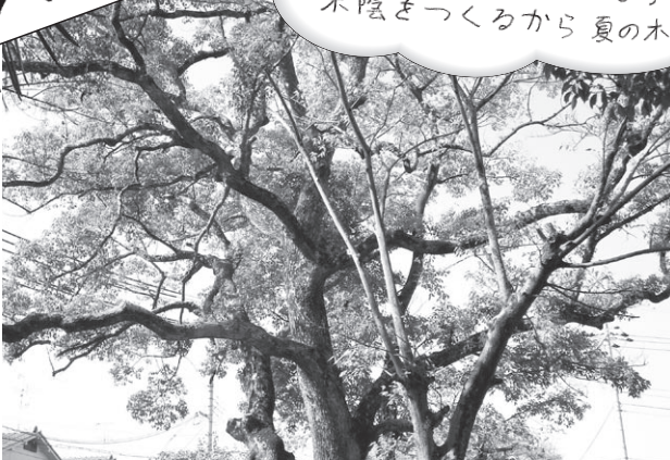
高さ14メートル 幹の周り2.8メートル 認定日 平成13年8月23日