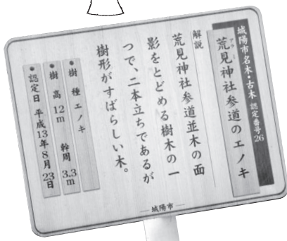
名木・古木 今市内には38本 あります

クスノキの木は成長がとても早く、昔は、まきや炭などとして使われていた。樹液がよく出るからカブトムシやクワガタがよく集まる。だから「森のファミリーレストラン」とも言えるだろう。樹齢は不明で、どんぐりの実をつける。クスノキの葉をよく見ると「トゲ」みたいなものがたくさんついている。