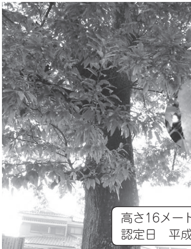
クスノキは学校にもあります。葉っぱの周りに「とげとげ」があります。

この木はエノキです。すごく大きくなります。エノキは、公園や神社によくある木です。大きいので、よくかまも見えるから、めじるしにされています。神社の神木として、大切に育てられています。