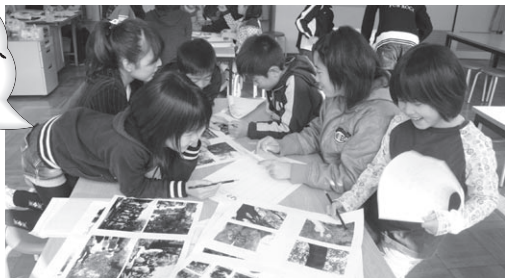
作ってくれた子どもたち