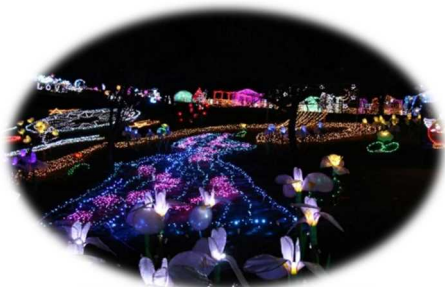
光のページェント TWINKLE JOYO