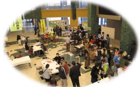
環境フォーラムの開催