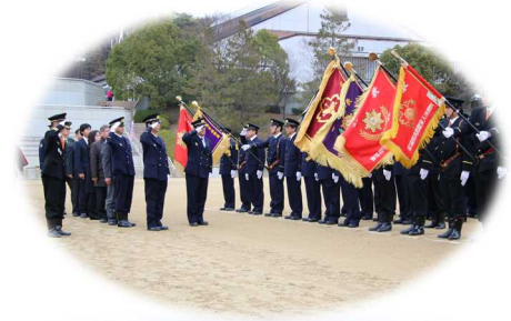
城陽市消防出初式