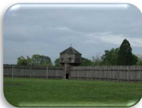
姉妹都市 アメリカ・バンクーバー市 バンクーバー岩