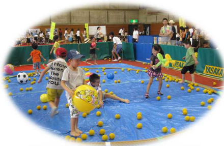
あそびのはくぶつ館