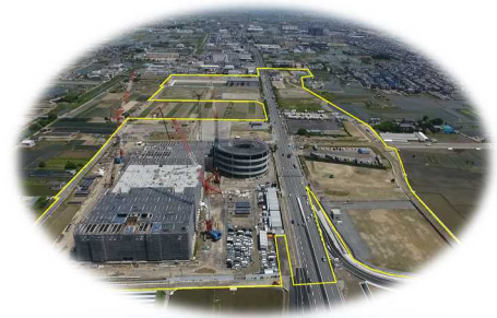
整備が進む久世荒内・寺田塚本地区 (平成29年6月時点)