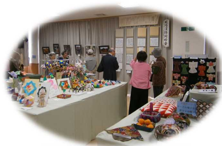
老人福祉センターサークルの作品展示