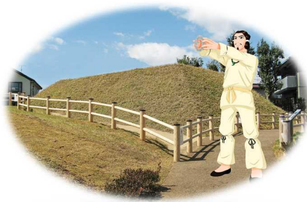
史跡芝ヶ原古墳とキャラクター