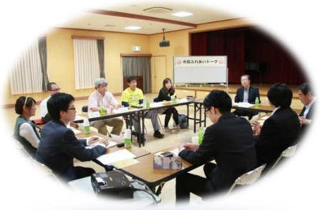
市長ふれあいトーク