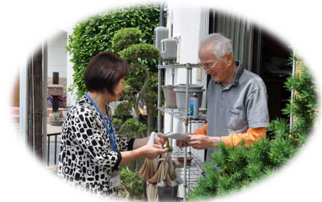
民生委員の訪問活動