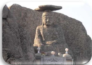
姉妹都市 大韓民国慶山市 冠峰石造如来座像