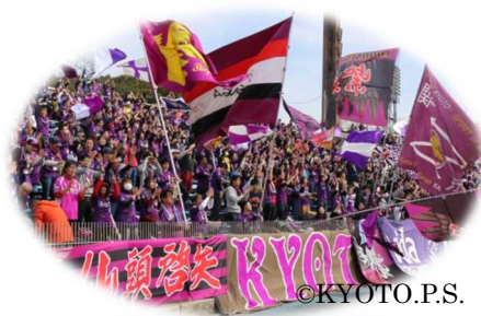
京都サンガ F.C.サポーターの応援風景