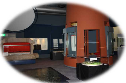
五里ごり館(城陽市歴史民俗資料館)