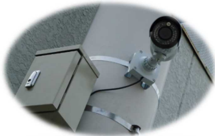
駅前広場等に設置している防犯カメラ