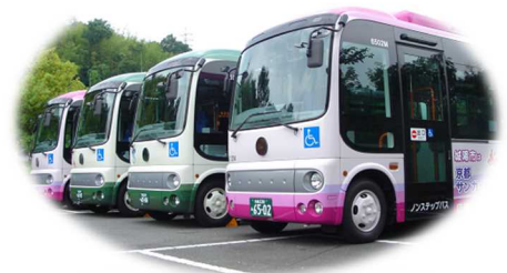
市民の足 城陽さんさんバス