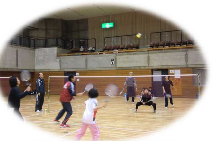
ファミリーバドミントン大会の様子