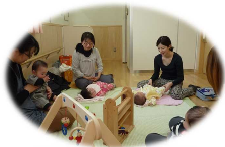
地域子育て支援センター「ひなたぼっこ」