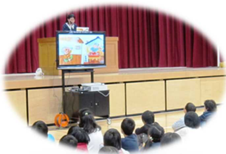
司書による読み聞かせ