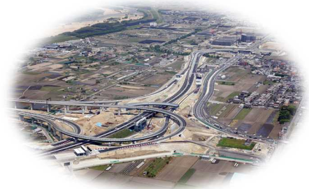
新名神高速道路 城陽 JCT・IC(平成 29 年 5 月時点)