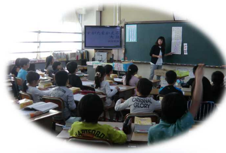
授業力向上研修会