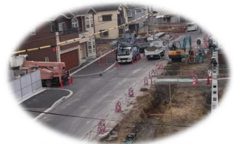
(都)塚本深谷線(工事中)