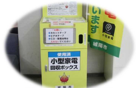
小型家電回収ボックス