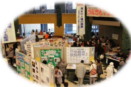
女(ひと)と男(ひと)の まつりさんさんフェスタ