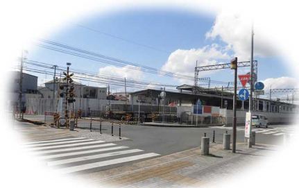
久世荒内・寺田塚本地区の 最寄駅の近鉄寺田駅