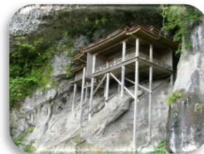
姉妹都市 鳥取県三朝町 三徳山三佛寺 投入堂