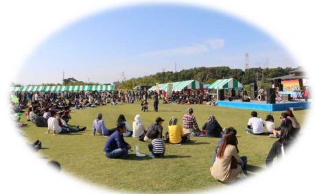
城陽五里五里の丘で開催される 城陽市緑化フェスティバル