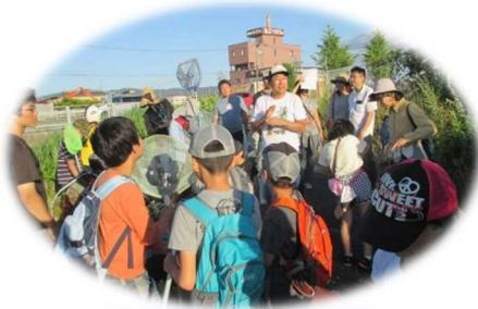
自然観察会の開催