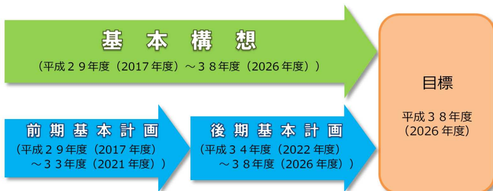
図 計画の期間イメージ

基本構想の計画期間は10年間（平成38年度を目標年次）、基本計画の計画期間はそれぞれ5年間（前期基本計画：平成29年度～平成33年度、後期基本計画：平成34年度～平成38年度）とします。