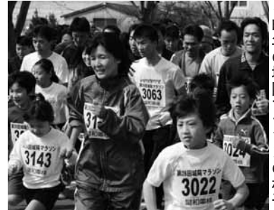
▲昨年の城陽マラソンの様子

▶日程 平成22年3月14日(日)9:00から受付/文化パルク城陽※雨天決行 ▶種目 ◎10キロコース…高校生男女、一般男女、一般男女(50歳以上) ◎5キロコース…中学生男女、高校生男女、一般男女、一般男女(50歳以上) ◎3キロコース…小学4~6年生男女、親子の部(小学1~3年生とその保護者) ▶参加費 一般・一般50歳以上・親子(1組)2,500円、高校生1,500円、小・中学生1,000円 問平成22年1月29日(金)までに募集要項<体育協会・市民体育館・各コミセンに設置>に必要事項を明記し、参加費と印かんを持って、郵便局または体育協会事務局(市役所寺田分庁舎内)へ直接