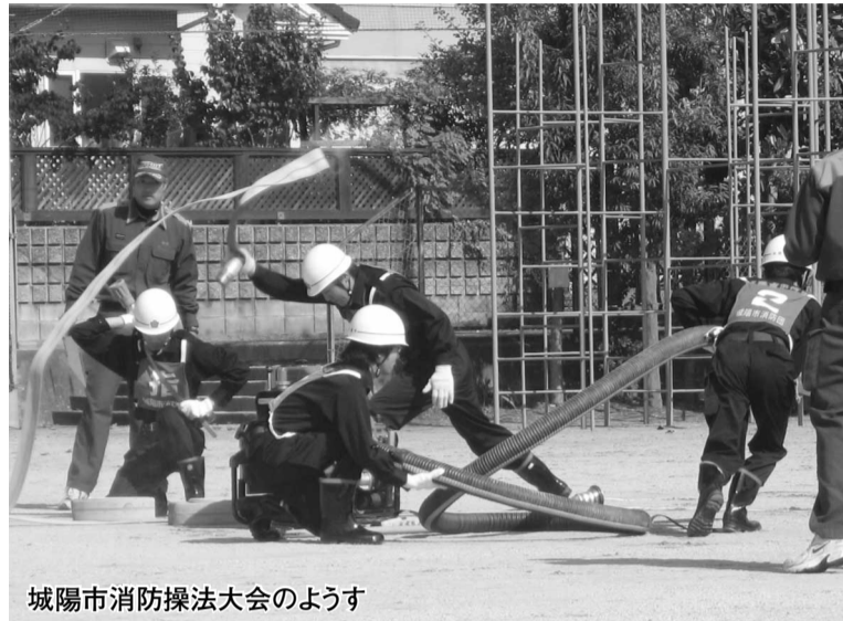
城陽市消防操法大会のようす