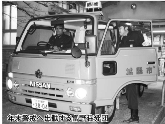
年末警戒へ出動する富野荘分団