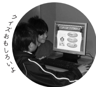
コンピュータもいろいろ

館内には、楽しみながら歴史を学べる工夫が数多くあります。その一つ、常設展示室にある円筒ブラス内には、パソコン4台を置き、歴史に関するクイズや市内の文化財検索ができます。