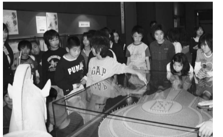
▲模型や展示物、パネルなどで分かりやすくなっています。興味深い内容の「樋口隆康文庫」。気軽にご覧ください。

その二つ目は、子どもたちが体験しながら、楽しんで歴史に親しめる工夫です。館の入口には、文化財のサイコロパズル、芝ヶ原古墳出土の土器を