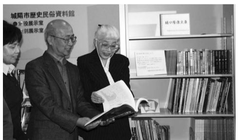
基にした立体パズル、古代衣装の試着ができるコーナーを設けています。こうした工夫によって歴史に興味を持ち、何回も足を運んでくれる子どもたちが増えています。