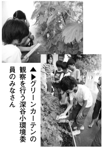
▲グリーンカーテンの観察を行う深谷小環境委員のみなさん

市ではグリーンカーテンの普及にあたり、そのモデル校として、深谷小学校環境委員会に協力を依頼しています。5・6年生で構成する環境委員会は、育成したグリーンカーテンを使って、温度の違いや蒸散などを観察し、その効果について学習しました。