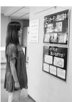
市役所1階ロビーでは、展示中のグリーンカーテンの啓発パネルがご覧になれます

グリーンカーテンとは、金網やネットなどの土台となるものを日の当たりやすい窓際に設置し、そこに生育の早いヘチマやゴーヤなどのつる性植物の種を植えて栽培するものです。これが一面に広がるま