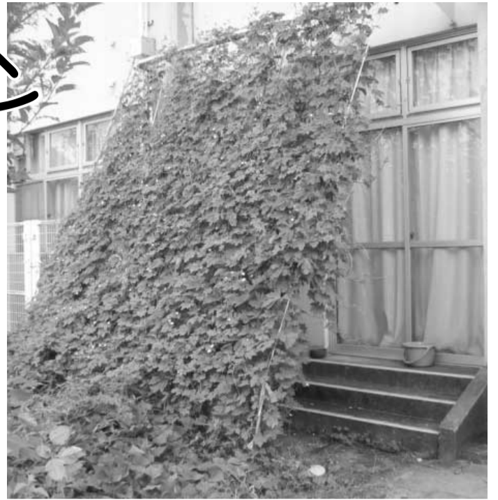
青々と茂ったゴーヤのグリーンカーテン (枇杷庄保育園)

私たちの身の回りで話題になっている地球温暖化。この問題は、単なる気温の上昇だけでなく、近年世界で起こっている台風増加や、農作物の収穫量減少などと結びついているとも言われています。市では地球温暖化を防止するため、さまざまな取り組みを行っています。その中にグリーンカーテンという手軽にできる取り組みがあることをご存じでしょうか。今回はグリーンカーテンの持つ効果や深谷小学校などでの取り組みについて特集します。