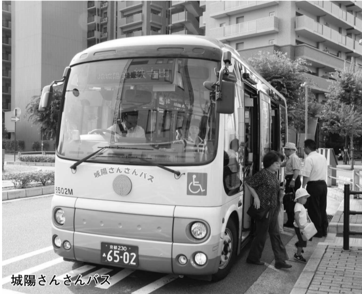
城陽さんさんバス

みなさんがより便利で快適にご利用いただけるよう、ダイヤや路線変更などの充実を図ってきた市内循環バス。“城陽さんさんバス”の名でも親しまれ、市民の欠かせない足として利用されています。今回はみなさんに、より身近な交通として親しんでいただけるよう、その利便性や魅力についてご紹介します。