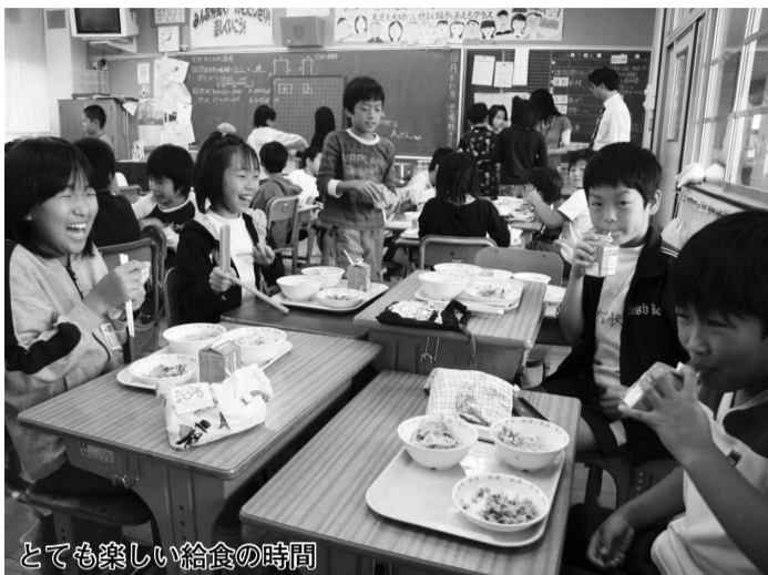
とても楽しい給食の時間