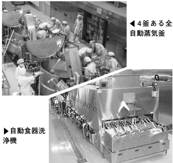
4釜ある全自動蒸気釜

最近、食料品の異常な値上がりが続いています。保護者のみなさんに負担を軽減するために、食費はすべて食材の購入に充てていますが、パ