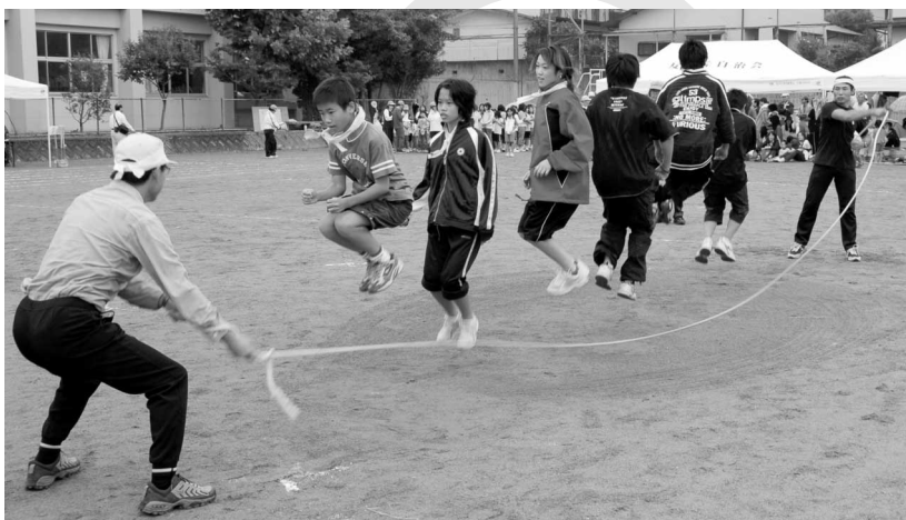
▲大勢での大縄跳びでは、楽しそうな笑い声が飛び交います

猛暑がやっと影をひそめ、さわやかな秋が訪れました。秋晴れは、私たちを活動的な気分させてくれます。特に、秋の恒例行事として親しまれている「区民運動会」は、城陽市社会体育振興会によって企画・運営され、地区のみなさん同士で楽しさを共有できる貴重な場となっています。今回は設立50周年を迎えた社会体育振興会を特集し、スポーツ普及への取り組みや、地域に根ざした活動についてお知らせします。