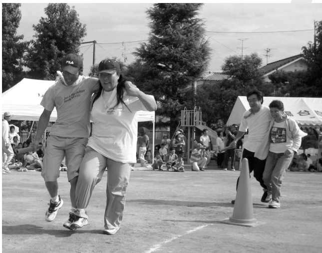
▲仲良く二人三脚でグラウンドを一周