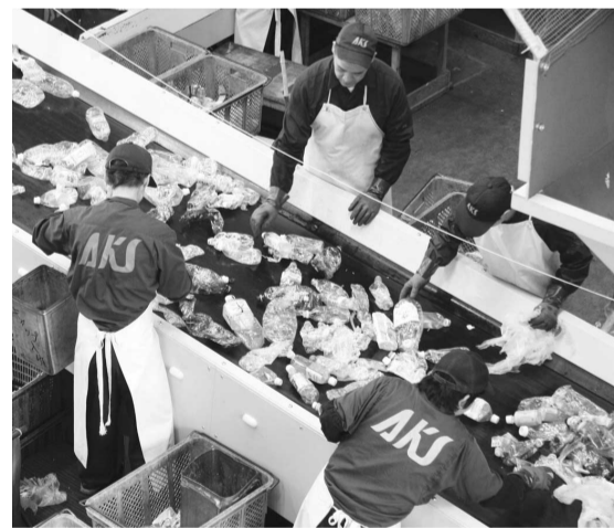
▼エコ・ポート長谷山での選別作業

資源ごみとして有効に利用するためにはみなさんの分別方法の徹底が大切となります。キャップとラベルを外し、水洗いして透明の袋で出してください。