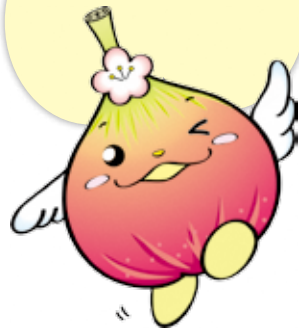
じょうりんちゃん