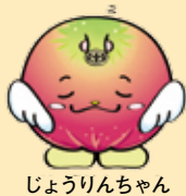
じょうりんちゃん

※期間最終月の10月は混雑が予想されますので、早めに受診しましょう。また、新型コロナウイルス感染症の予防対策として、完全予約制にしている医療機関もあります。早めに医療機関に予約状況を確認の上、マスクを着用して受診してください