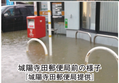
城陽寺田郵便局前の様子

主な被害状況としては、古川、嫁付川・宮ノ谷都市下水路などが増水し、付近の側溝から水があふれ、府道内里城陽線など各所の道路が冠水し、寺田や久世地区で、土砂流出5カ所、道路陥没3カ所などの被害がありました。また、住宅においては、近鉄寺田駅周辺を中心に、寺田、平川、枇杷庄などの広範囲で床上46棟、床下515棟、計561棟(8月14日調査時点)が浸水しました。さらに、文化パルク城陽においても、南側道路が冠水し大量の水が敷地外か