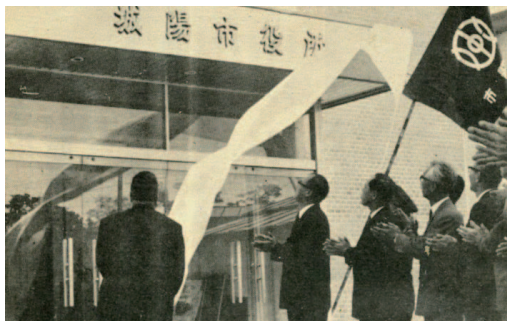
市役所看板の除幕

また富野の民家で「城陽」の地名が記入された明治44年の板が見つかっています。さらに、青谷の造り酒屋では、