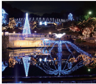
キラキラと輝くイルミネーション

▼期間 12月1日(土)～25日(火) ▼点灯時間 午後5時30分～9時30分(予定) ※点灯式：12月1日(土)午後5時15分 ▼場所 鴻ノ巣山運動公園、文化パルク城陽、各コミセン、ぱれっとJOYO、JR・近鉄の駅周辺商店街