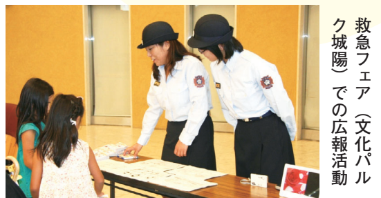
救急フェア(文化バルク城陽)での広報活動

わたしたちのまちを一緒に守るための消防団。地域を知る人であるからこそできることがたくさんあります。消防本部と協力して地域の中心として活躍し、市民の安全を守るため、今後もさらなる活躍が期待されます。みなさんのご支援とご協力をお願いします。