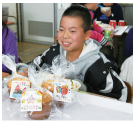
◀オリジナルデザート給食に登場!

今後、市の特産物を使って、年に1回ぐらいのオリジナル給食の提供を企画しています。