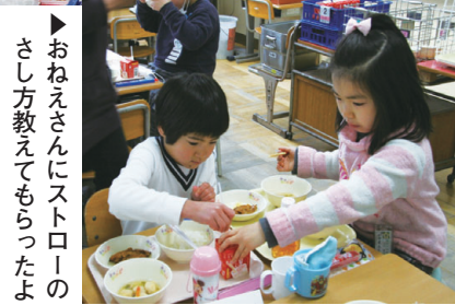
▶おねえさんにストローのさし方教えてもらったよ