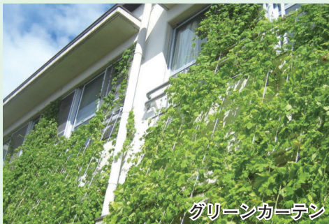
グリーンカーテン

そして、今回、平成25年度から平成29年度を計画期間とする第2期計画、「城陽市地球温暖化対策実行計画(区域施策編)」を策定しました。