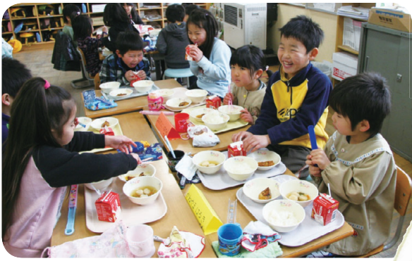
▶とっても楽しい給食の時間