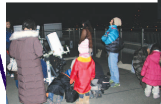
体観測会~半月、木星、冬の星座の観察~」が開催されました。

今回の観測会には、約45人が参加。冬の星座や、木星を観察することができました。みなさんからは、「きれい」や「月のでこぼこが見えた!」といった声も聞かれました。