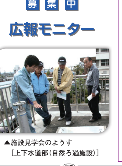
▲施設見学会のようす [上下水道部(自然ろ過施設)]

募集中 広報モニター 市が行っている広報活動について、一緒に考えてみませんか?市内の施設などの見学も行っていただけます。 ▼対象 市内在住の広報活動に関心を持って、活動内容(平日の昼間)に出席し、毎月アンケートを記入して提出 ※会議などの意見や名前がホームページなどに掲載される場合があります ▼定員 15人※多数の場合抽選。結果は3月末日までに全員に通知 ☎市民活動支援課広報 ☎(56)4051