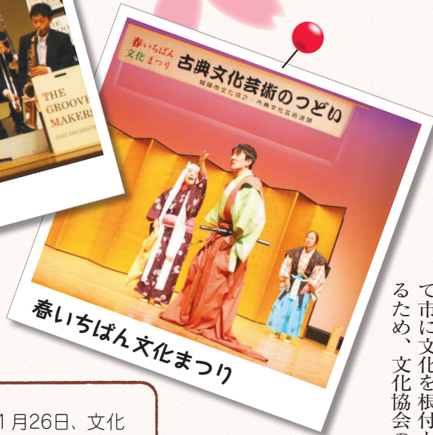
春いちばん文化まつり