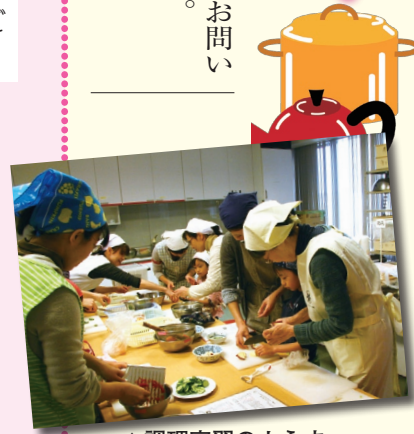
▲調理実習のようす

ポイント スキムミルクは、少量使うだけでも、たくさんのカルシウムがとれます。牛乳やヨーグルトが苦手なお子さんに、ぜひ試してみてください。