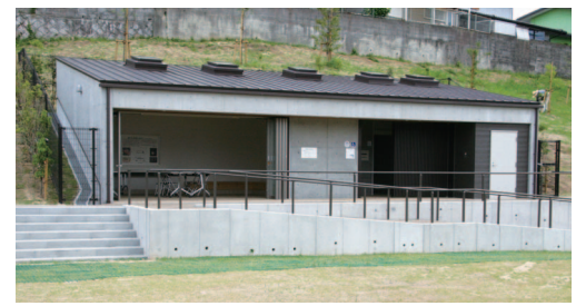
▲ 復元された墳丘の後方部。発掘調査の成果を元に築造当時の姿に復元を行いました

▶ 休憩室とトイレを備えた便益施設。また、休憩室内には、説明板と銅釧(どうくしろ)と四獣形鏡(しじゅうけいきょう)のレプリカがあり自由に触ることができます。古代の技術を身近に観察することができます