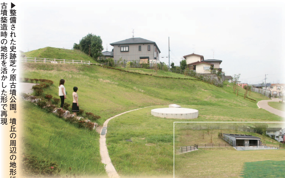
▶ 便益施設を備えた多目的広場 (公園東側)