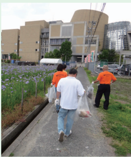
▲昨年のクリーン活動の様子

市内には美しいまちをめざして、道路清掃や草抜き、ごみ拾いなどをやっている団体が多くあります。また、河川の清掃活動をしている団体も。活動団体の一部をご紹介します。(下記表参照) 現在これらの団体が