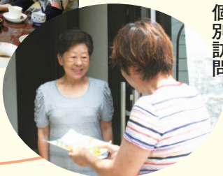
民生児童委員さんの 個別訪問