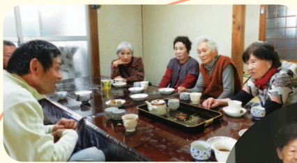
校区で行われている ふれあいサロン