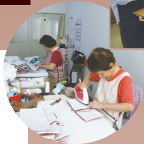
◀手仕事で、コースターやブックカバーづくりに頑張っています