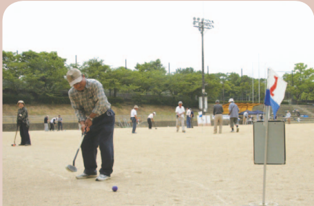
第1回 会員親睦グラウンドゴルフ大会

30周年の記念として、6月15日に会員とOB会員の参加で、体力づくりの向上を目的に行われた親睦会