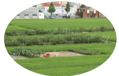
水田の中に残る島畑。木津川流域の島畑は文化景観として紹介されています

つかりました。南山城の水田・島畑といった、土地利用のあり方を検討する上で重要な資料となります。