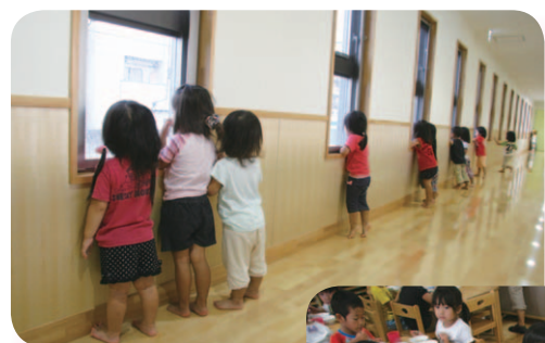
◀園舎2階に設置した「電車の道」。窓から見える電車にみんな夢中