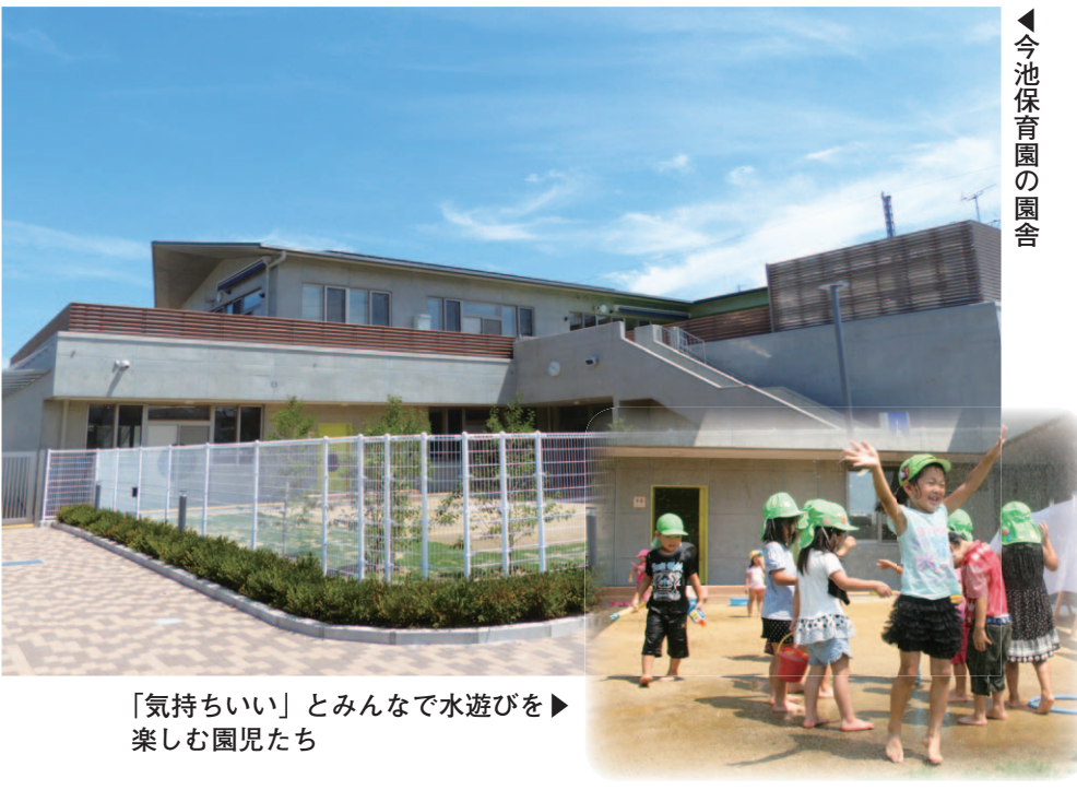
「気持ちいい」とみんなで水遊びを▶ 楽しむ園児たち