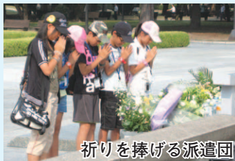
祈りを捧げる派遣団

8月15日は終戦記念日。みなさんも、今一度、平和の大切さについて考えてみませんか。市では今後も、継続して平和事業に取り組んでまいります。