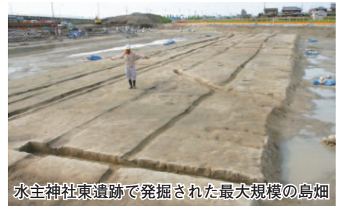
水主神社東遺跡で発掘された最大規模の島畑

古代から中世にかけて土地を区画する条里型地割りが行われますが、この地割りに沿うように島畑が作られ、その位置が今の水田の区画に合致していることもわかりました。今回の調査では、ほかに弥生時代の建物跡や平安時代の井戸も見