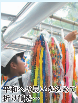
平和への思いを込めて折り鶴を…

初日は、広島平和記念資料館を見学し、被爆体験者から講話を聞きました。そして翌日には、広島平和記念公園内の平和都市記念碑に献花し、市民のみなさんから託された千羽鶴を「原爆の子の像」に捧げました。広島派遣を終えた子どもたちは「講話を聞いて、戦争は悲しみや苦しみが生み出さないと感じた」「これから平和の大切さを伝えていきたいと思った」と感想を話してくれました。