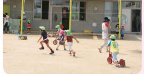
◀広々とした園庭でみんなでかけっこしたり、遊具で遊んだり元気いっぱい