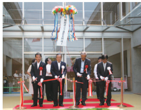
◀7月25日に行われた竣工式の様子。喜びのテープカットとくす玉割り

この今池保育園の運営は、基本的な保育内容や保護者の負担が変わらず運営効率が高い公設民営方式(市が認可を受けた保育所を民間の法人が運営する方式)を採用し、指定管