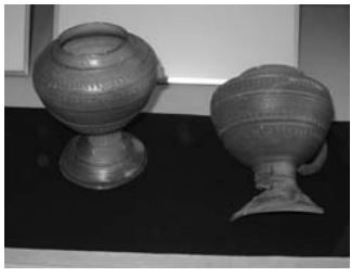
▲芝ヶ原9号墳出土 とってつきかんけいこ 把手付短頸壺