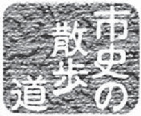
市史の散歩道 五里ごり館 (歴史民俗資料館) ☎(55)7611 No.285

市の広報紙「広報じょうよう」は、月3回(1日・11日・21日)発行し、各ご家庭へは新聞折込(朝日・毎日・読売・京)