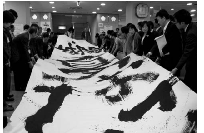
1階ロビーで、庁舎などに掲示する啓発幕を来庁者や職員たちと持ち上げ、事業の大きさを実感…