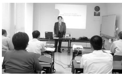
▲事業者モニター交流会で「事業所における省エネの取り組み」を受講