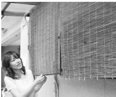
台所にすだれをかけて、暑さを少しでも防ぐように...

「エコ」という言葉に何か始めよう...小さなことから。1人ではなく家族みんなで家の中をチェック! ○使わないプラグはすぐ抜く! 果たして毎月の電気代は? もう少し家族の協力が必要 ○暑い毎日、西日を少しでも涼しく感じるために、すだれを利用! 夕方のちょっとしたエコ...。小さなことから、自分ができることから、エコ活動に家族でチャレンジしています。