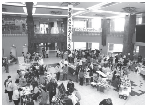
▲市民団体による手づくり作品展(市民プラザ)

「文パル」の愛称で親しまれる「文化パーク城陽」。平成7年11月1日にオープンし、今日で15周年を迎えました。今号では私たちに、出会い・夢・感動を与え、飛躍し続ける文化パーク城陽の魅力をお伝えします。