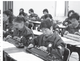
▲大正琴の祭典に向けて練習に励むみなさん