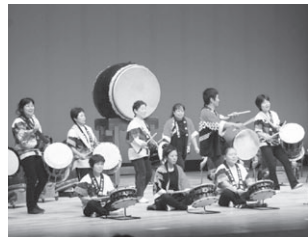
▲和太鼓フェスティバルプレ大会の様子

先日の和太鼓フェスティバルプレ大会では、創作和太鼓団体による、力強い湧きあがる鼓動が会場内に響きました。そして、大正元年から間もなく100周年を迎える大正琴。プレ大会でのさまざまな流派による素晴らしい演奏をお楽しみください。☎国民文化祭推進室☎(56)5034