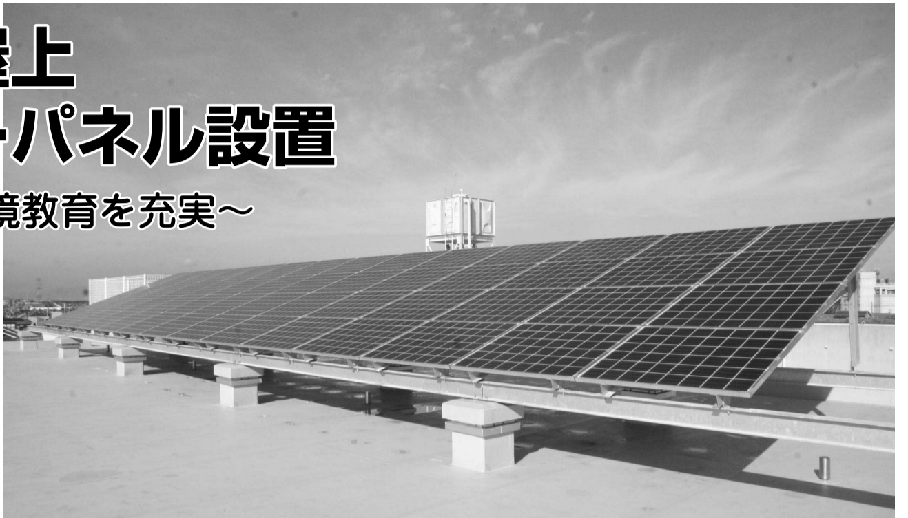
▲大空の下、降りそそぐ太陽光を受けるソーラーパネル

富野小学校 ☎(52)0009 学校教育課 ☎(56)4004 教育総務課 ☎(56)4003