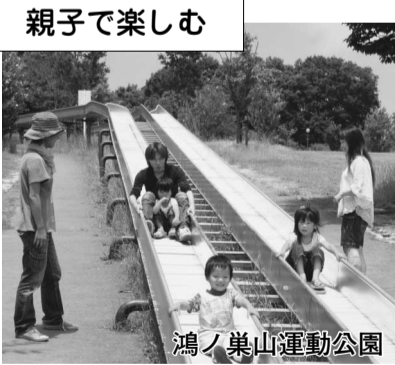
鴻ノ巣山運動公園

あらず観光にも掘り農園は自分の手で収穫を体験できるのがいいですね。寺田にも伝来の歴史を想像しながら堪能してください。