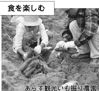
あらず観光にも掘り農園

溪流や竹やぶ、くぬぎ、四季の山野草など、里山の雰囲気が多く残っています。童心に返って散策してみませんか。