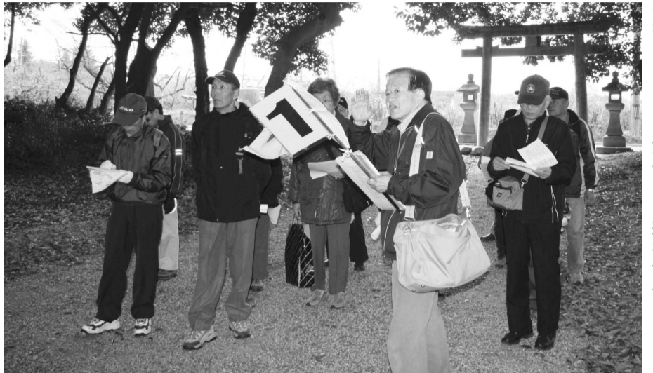
神社の説明を聞いて、熱心にペンを走らせる観光客のみなさん(観音堂の目録神社で)

豊かな緑と、格式ある文化財：城陽市は、「自然と歴史にあふれるまち」という顔を持っています。長い時間の流れで築き上げられたこの貴重な財産を、自分たちの手・足・豊富な知識を使って、魅力ある観光地として紹介する城陽市観光案内ボランティアクラブをご存じですか。今回は、5年にわたり活動を続けていた観光案内ボランティアクラブを特集し、城陽の良さを知り尽くしたクラブのみなさんから、おすすめの観光スポットをご紹介します。